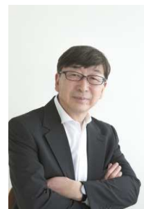
伊東 豊雄 氏